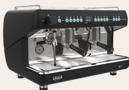
GT 7 2GR PS NERA