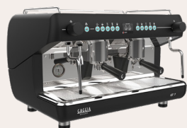
GT 7 2GR NERA