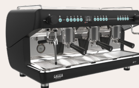
GT 7 3GR NERA